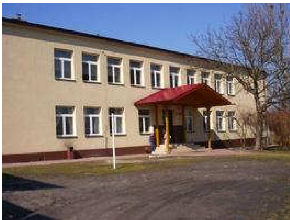
Rysunek 4. Budynek szkoły podstawowej i gimnazjum.

Działania edukacyjne realizuje działająca od 4 listopada 1893 Szkoła Podstawowa.