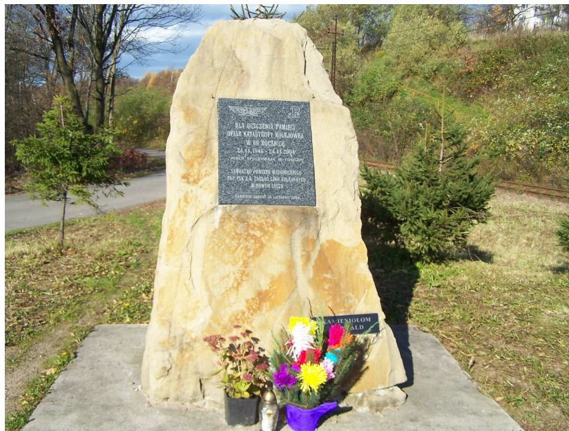
Rysunek 3. Obelisk na Filkówce

Katastrofa kolejowa wydarzyła się 24 listopada 1944 roku. Pociąg relacji Zakopane - Kraków pod Filkówką zderzył się z wojskowym pociągiem towarowym. Pociąg jadący z Zakopanego do Krakowa na stacji Kalwaria Zebrzydowska został skierowany na drogę okrężną przez Wadowice i Spytkowice, gdyż partyzanci uszkodzili tor na linii Kalwaria Zebrzydowska - Skawina. Po tym samym torze od strony Wadowic jechał pociąg wiozący zaopatrzenie dla niemieckiego wojska. Według naocznych świadków dwa wagony pasażerskie (drewniane bokówki) uległy całkowitemu zniszczeniu. W wyniku zderzenia zginęło około 130 osób, a ponad 100 zostało rannych. Byli to głównie mieszkańcy Ziemi Wadowickiej. Według liczby ofiar śmiertelnych była to prawdopodobnie najtragiczniejsza katastrofa kolejowa w historii Polskich Kolei.