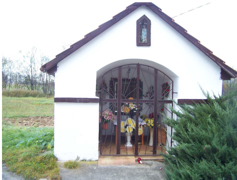
Rysunek 2. Kapliczka w Chlewnej.

Barwałd Średni nie należy do miejscowości z dużą liczbą zabytków. Dla mieszkańców cennymi są liczne kapliczki pochodzące z XIX w. Najczęściej zbudowane z kamiennych płyt pokryte dachówką, ale też kamienne krzyże i figury na drzewach. Można doliczyć się dziesięciu takich zabytkowych obiektów kultu religijnego. Przy niektórych obecnie spotykają się okoliczni mieszkańcy na nabożeństwach majowych i różańcowych.